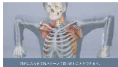
目的に合わせて数パターンで取り組むことができます。